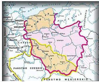
Polska w czasach Mieszka I