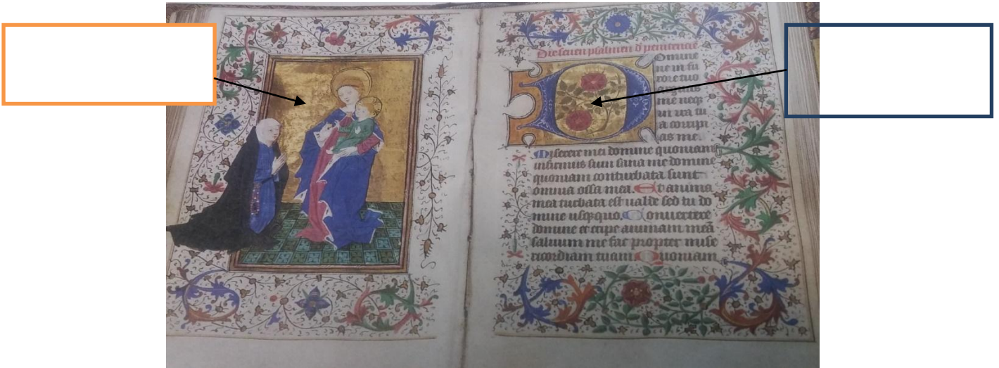
K. Brookfield, Pismo, Warszawa 1996, s.25-27

miniatura, grotteska, inicjał, arabeska.